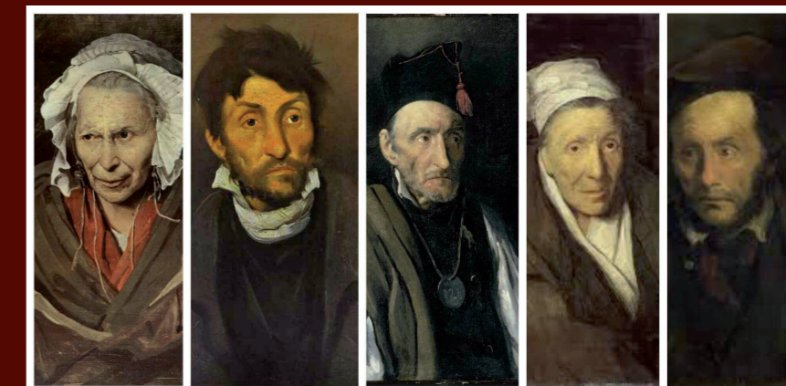
I ritratti di alienati, Théodore Géricault

SERVIZIO SANITARIO REGIONALE EMILIA-ROMAGNA Azienda Unità Sanitaria Locale di Reggio Emilia IRCCS Istituto in tecnologie avanzate e modelli assistenziali in oncologia